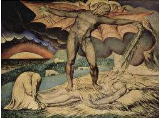
Dipinto di William Blake Satana versa le piaghe su Giobbe

Il Signore risponde: “Ebbene, tutto quello che possiede è in tuo potere: soltanto non stendere la mano sulla sua persona.”